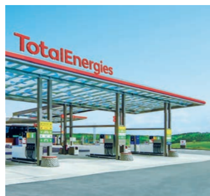
Die Tankstellen im neuen Look von TotalEnergies

CO 2 -Einsparung ist der Schlüssel zur Energiewende. Das neue Logo TotalEnergies symbolisiert das gesamte Spektrum der Energien und unsere Energiereise hin zu weniger Emissionen.